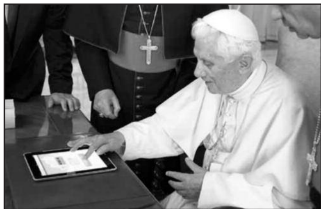
Папа Бенедикт XVI использует iPad, чтобы открыть ватиканский новостной портал www.news.va . 29 июня 2011 года.

Поток общения сегодня в большей своей части представлен вопросами и поиском ответа на них. Поисковые системы и социальные сети являются пространством общения для многих людей, ищущих совета, подсказки, информации, ответа. В наши дни Интернет все больше становится местом вопросов и ответов; более того, современный человек нередко становится жертвой вездесущей рекламы, когда его буквально заваливают ответами на вопросы, которые он никогда не задавал, и навязывают по-